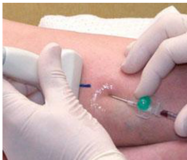
Billede: Under ultralydsscanning indføres et venflon (drop) i den syge vene på benet.

Behandlingen foretages ultralydsvejledt. Benet placeres først på et højere liggende leje for at tømme de overfladiske vener.