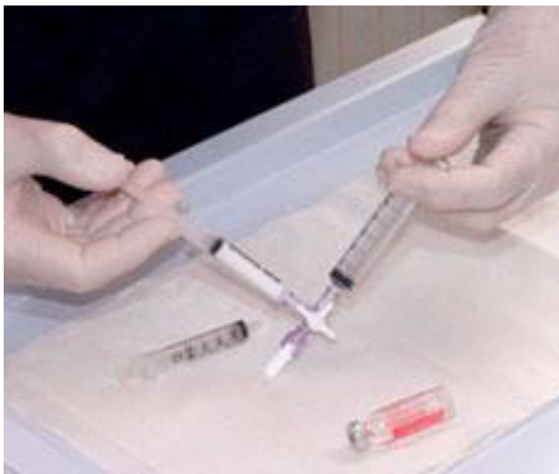
Billede: Medicinen der skal aflukke blodkarret bearbejdes til skum.

Skummet gøres dernæst klar og sprøjtes ind i venen. Skummet fordeles hurtigt i venen, hvilket følges via ultralydsscanner. Indsprøjtning af skum fortsættes, indtil skummet når åreknuderne.