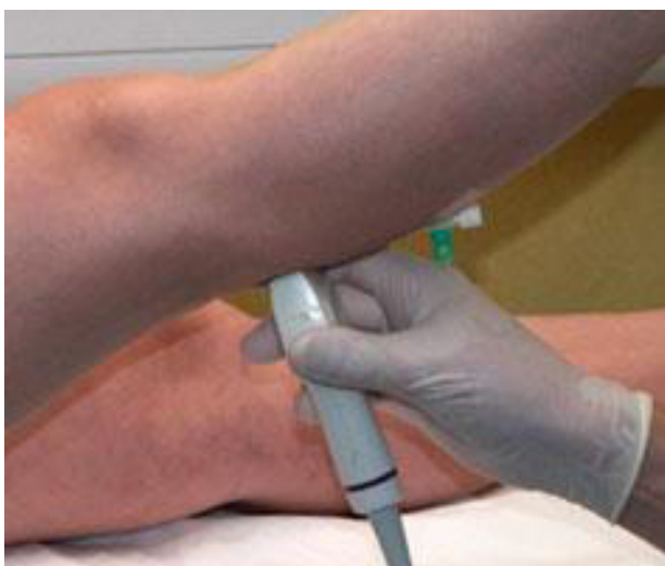
Billede: Benet løftes, skummet indsprøjtes gennem den grønne kanyler, og udbredningen af skummet følges ved ultralydsscanning.

Skummet gøres dernæst klar og sprøjtes ind i venen. Skummet fordeles hurtigt i venen, hvilket følges via ultralydsscanner. Indsprøjtning af skum fortsættes, indtil skummet når åreknuderne.