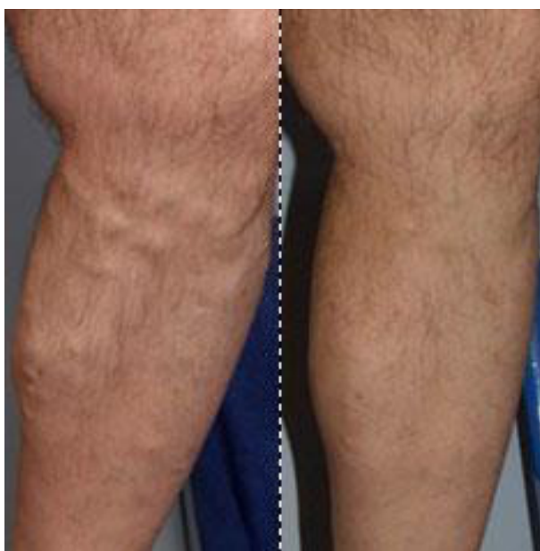
Billede: Tv. Benet med åreknuder INDEN skumbehandling. Th. Slutresultat 14 dage efter skumbehandling af åreknuder på lår og underben.

Normalt behandles ét ben ad gangen. Hvis begge ben er medtaget af åreknuder, behandles de med 1-2 ugers mellemrum.